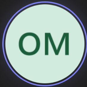
oata macheta (Invitado)