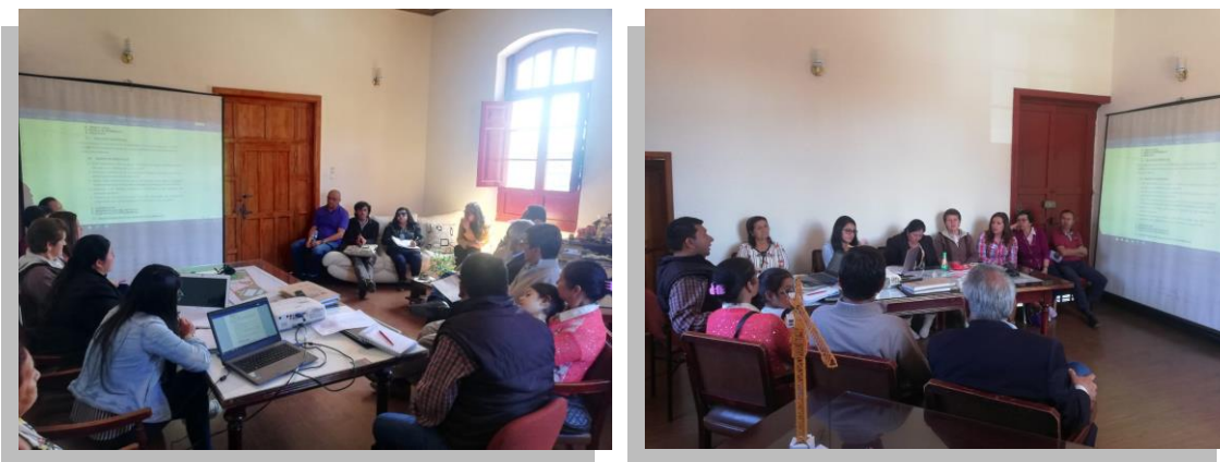
Foto N. 3 - 4 Socialización Matriz de armonización

“NEMOCÓN SOMOS TODOS - POR LA REVOLUCIÓN DE LAS IDEAS”