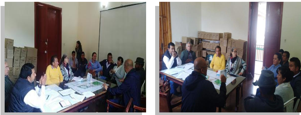
Foto N.1 -2 Socialización actividades

La primera reunión de CIDEA se realizó con el fin de recopilar la información requerida para la elaboración de la memoria técnica del municipio de Nemocón, durante la reunión se tuvo en cuenta varios aspectos del municipio, como las actividades realizadas durante la vigencia y el compromiso por parte del comité para la elaboración de dicho documento.