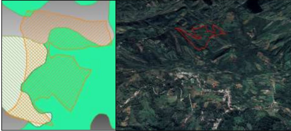
Ilustración 5. Predio San Jorge Vereda Chapilla.