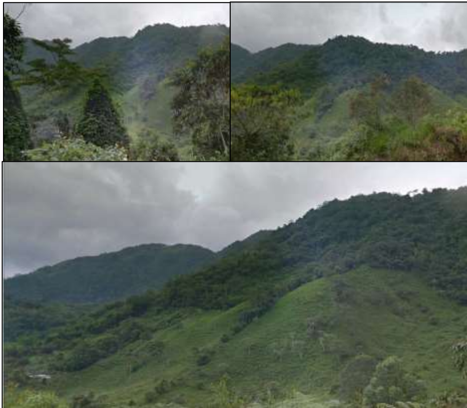
Ilustración 3. Registró Fotográfica visita de campo agosto de 2022

Verificando que se tenía un predio que había cumplido con las especificaciones técnicas para compra, y que tenía ya una viabilidad ante la Corporación Autónoma Regional de Cundinamarca CAR, se adelantó visita de campo, el día 23 de Septiembre de 2022, a la Vereda Nacopay, con el fin recopilar información de los respectivos propietarios.