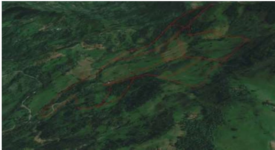
Ilustración 6, Predio Ubicados en el Municipio de Pacho Cundinamarca

Visita de Campo Noviembre de 2022: La Tercera visita de campo se desarrolló en el municipio de Pacho Cundinamarca, sin resultados positivos, en la Vereda de Serrezuela, con un total de Ocho (8) predios, en los cuales se evidencia de igual forma una amplia cobertura vegetal, con cercado vivo.