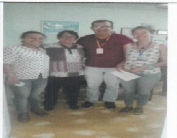
Fotografía 4 Se presentaron planos, mapas y videos relacionados con el complejo de humedales.