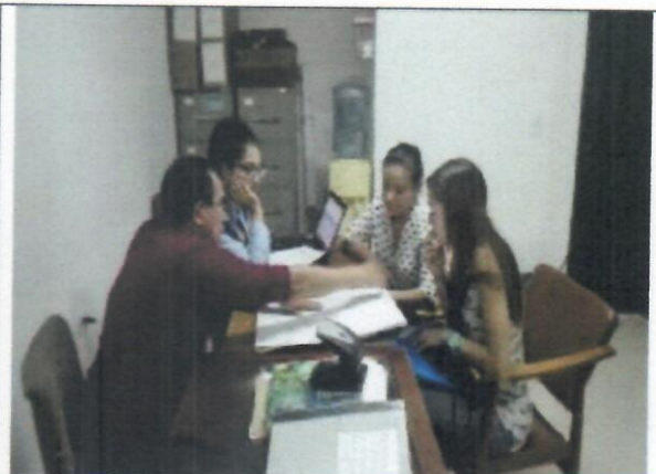
Fotografía 2 Cada grupo lo acompañaba un docente o director del curso correspondiente, el número de estudiantes no superaba los veinte (20).