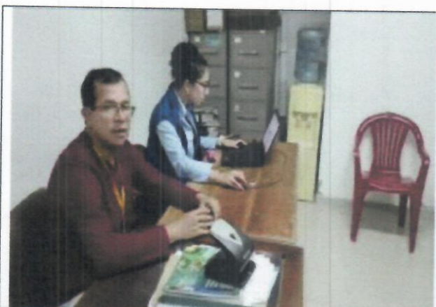
Fotografía 1. Los grupos fueron conformados por los docentes encargados de la organización del evento y representaban a todos los niveles académicos.