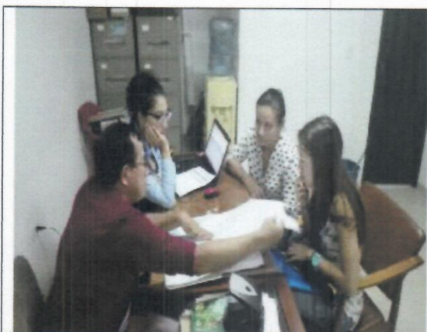
Fotografía 3. Cada estudiante explicaba un tema específico con ayuda de un televisor y un computador.