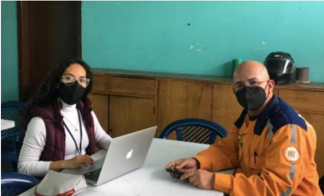
Imagen 1. Registro fotográfico