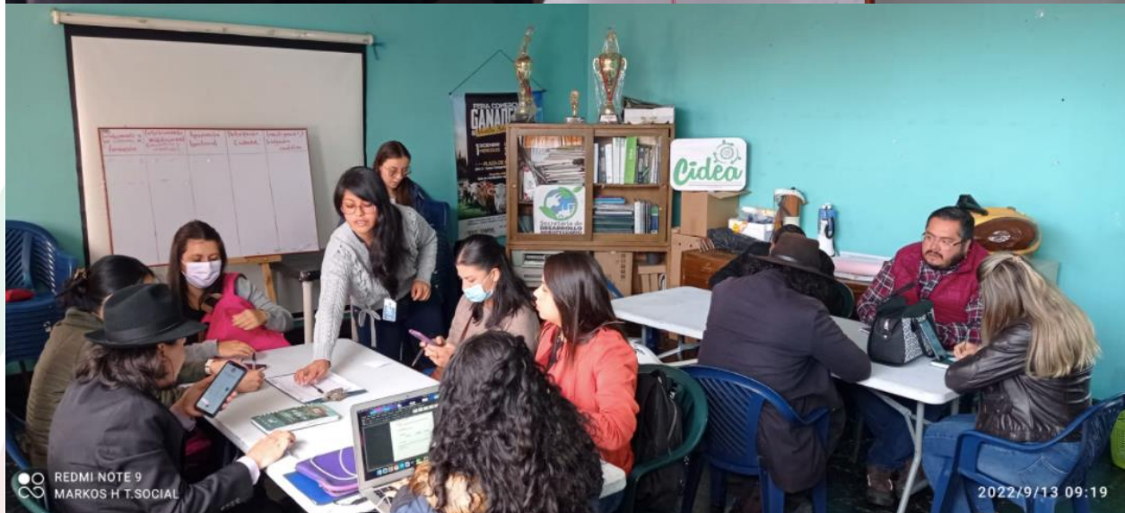
Imagen 1. Registro fotográfico