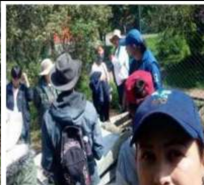
Ilustración 1. Implementación capacitación y caminata humedal+ Neuta Adulto mayor - Soacha 11/07/2023