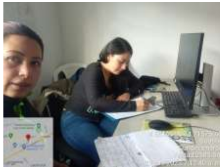
Ilustración 1. Mesa secretario técnico- Soacha 29/06/2023 Julio 2023