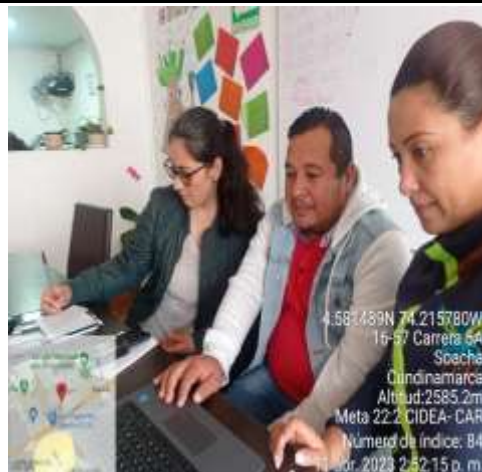
Ilustración 1. Segunda Mesa de Trabajo Secretaria Técnica del CIDEA Soacha el 11/04/2023