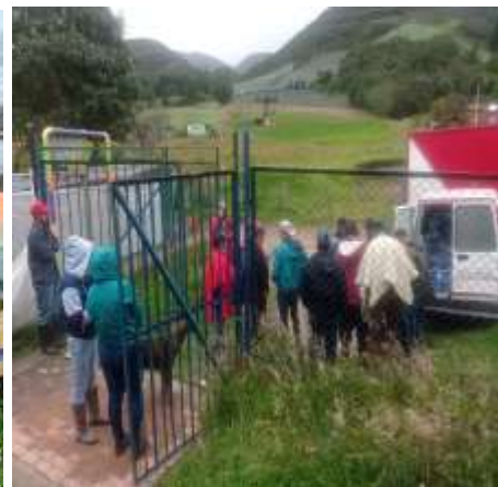
Ilustración 2. Feria de servicios Vereda Hungría - Soacha 15/08/2023