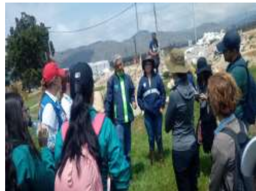
Ilustración 1. Visita capacitación Humedal Santa Ana - Soacha 10/08/2023