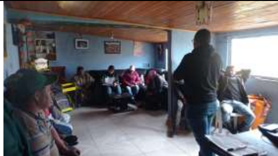
Ilustración 1. Actividad implementación en la vereda alto de cruz del municipio de Soacha la cual consistió en capacitación de negocios verdes a la comunidad en dos grupos uno en el salón comunal de la vereda y el segundo en la vivienda de un usuario de la vereda el día 9/10/2023

Corporación Autónoma Regional de Cundinamarca –CAR Dirección de Cultura Ambiental y Servicio al Ciudadano