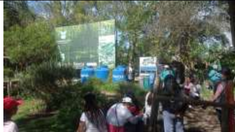
Ilustración No 3 Recorrido y capacitación en biodiversidad dirigido a la comunidad de hogares compensar en el municipio de Soacha en articulación con la estrategia humedales de la dirección de cultura ambiental y servicio al ciudadano el día 9/11/2023

Corporación Autónoma Regional de Cundinamarca –CAR Dirección de Cultura Ambiental y Servicio al Ciudadano