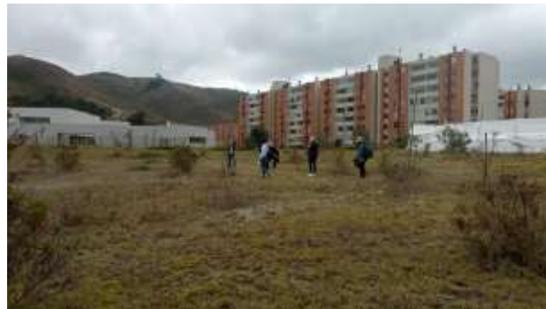
Ilustración 1. Actividad implementación mediante acompañamiento a la jornada internacional de la limpieza en el humedal maiporé en compañía de la administración municipal secretaria de ambiente representantes de la registraduría y Car en el municipio de Soacha el día 19/09/2023