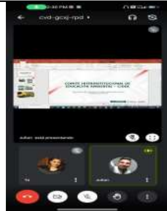
Ilustración 2. Comité ordinario CIDEA-Virtual - Soacha 25/07/2023