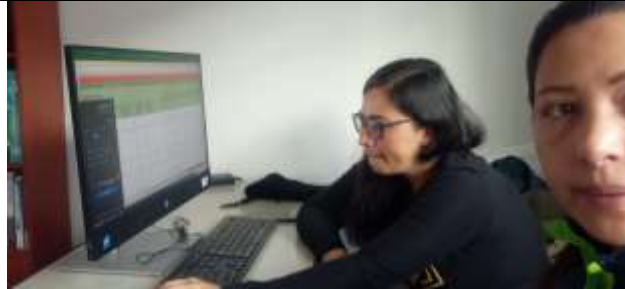
Ilustración 1. Implementación Humedal Neuta- Centro día Soacha 25/05/2023 Junio 2023