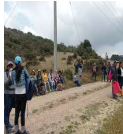
Ilustración 2. Actividad de Implementación caminata Paramo Cruz Verde - Soacha 22/03/2023