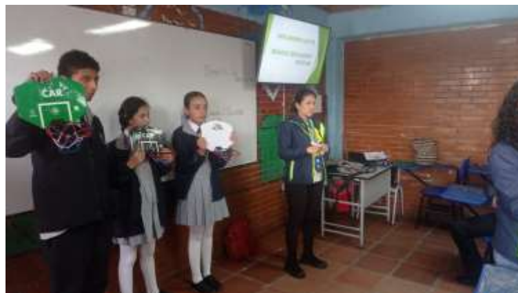
Ilustracion No 1 Actividad de implementacion mediante capacitacion En la institución