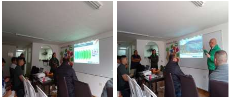
Ilustración No 1 Comité extraordinario cidea, donde se presentaron los procedimientos de vigencia 2022, Soacha – 28/02/2023