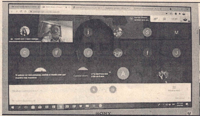
CIDEA – Mesa virtual 05 de abril del 2021 Autor