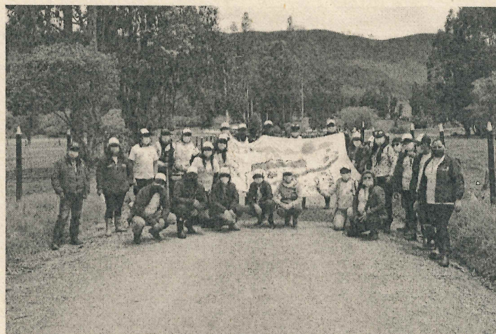
ACTIVIDAD DE IMPLEMENTACIÓN – 04 de mayo Autor