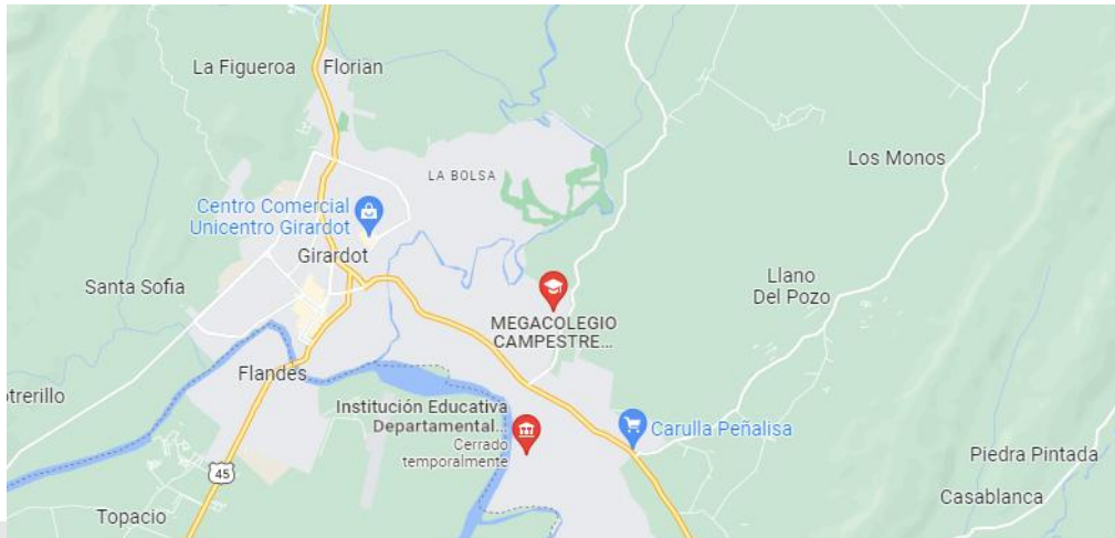
Figura. Ubicación geográfica Institución Educativa Departamental Antonio Ricaurte – Megacolegio.

Es de destacar que la población estudiantil del Megacolegio (I.E.D.A.R.) proviene tanto de la zona rural como urbana haciendo de este proyecto ambiental escolar en su formación, llegue en su práctica a los hogares de la comunidad educativa, tanto a veredas como barrios y conjuntos residenciales del municipio.