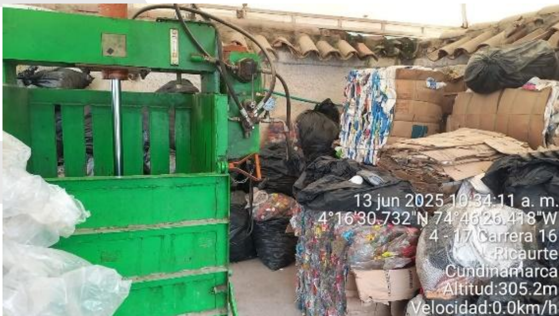
Alistamiento y almacenamiento de Residuos sólidos en la Unidad de Almacenamiento Pacande de la Secretaria de Ambiente, Agricultura y Desarrollo Rural.