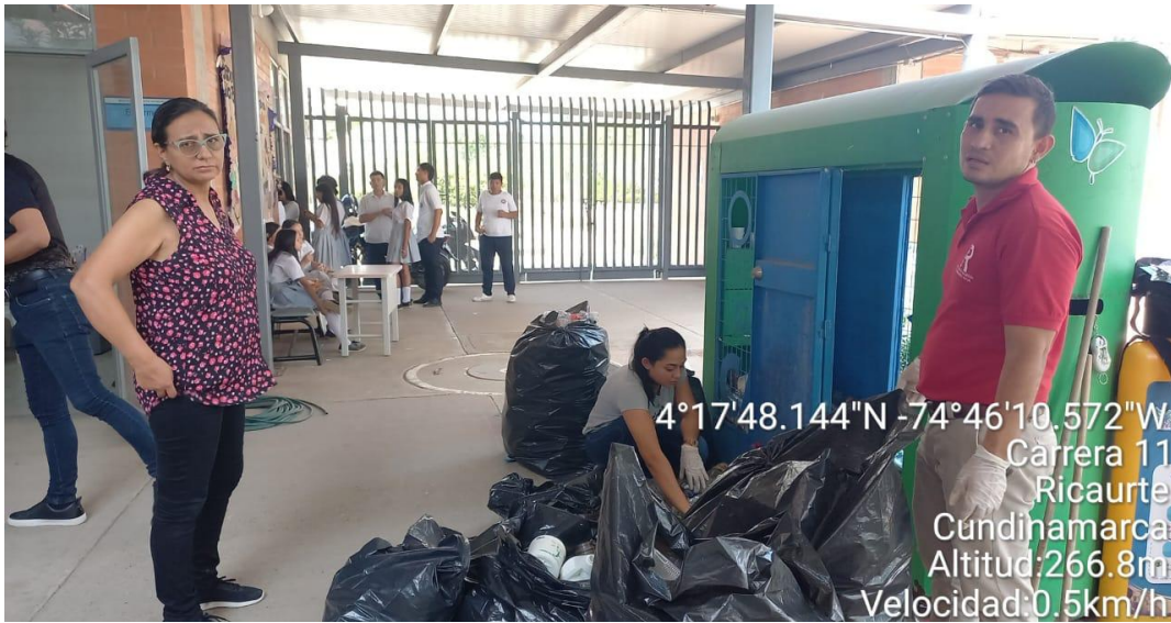
Recolección, separación Residuos Sólidos inorgánicos de Petcar de la Institución Educativa Departamental Antonio Ricaurte.