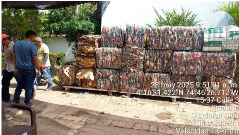
Alistamiento de Residuos sólidos en la Unidad de Almacenamiento Pacande de la Secretaria de Ambiente, Agricultura y Desarrollo Rural.