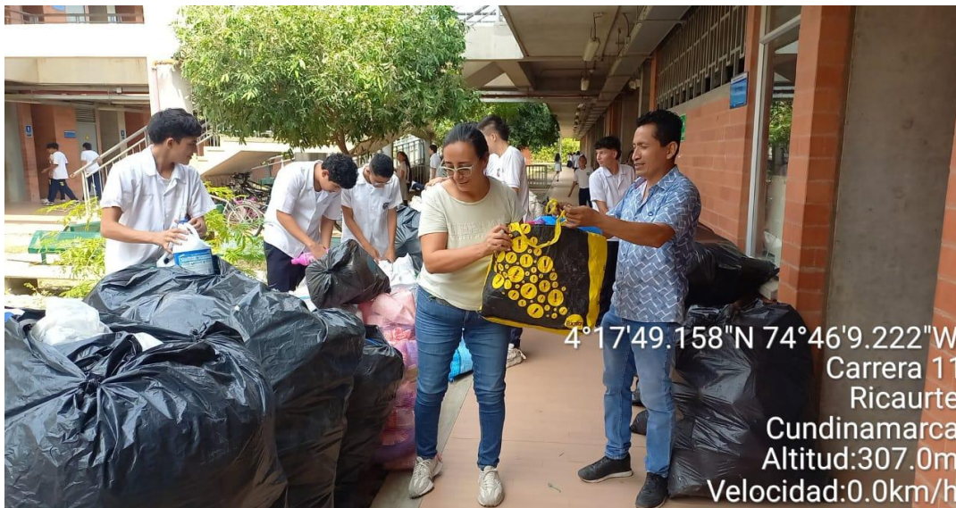
Recolección y separación de petcar en la Institución Educativa Departamental Antonio Ricaurte – Megacolegio, con estudiantes.