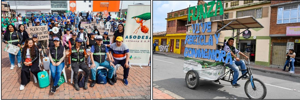
Imagen 2. Asociados ASODESA COLMENA y representación de Funza, Vive y Recicla