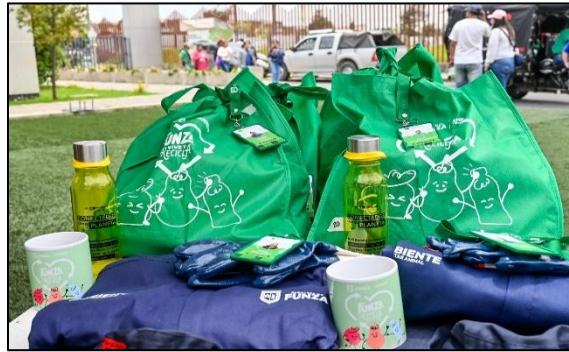
Imagen 9. Kit

Para cerrar la conmemoración del Día Nacional del Reciclador, se realizó la entrega de un kit a cada uno de los recicladores participantes del evento. El kit estuvo compuesto por un overol, una gorra pesquera, guantes, un mug, el carné de identificación como reciclador de oficio y un souvenir cortesía de OPAIN.