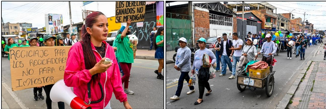
Imagen 7. Marcha