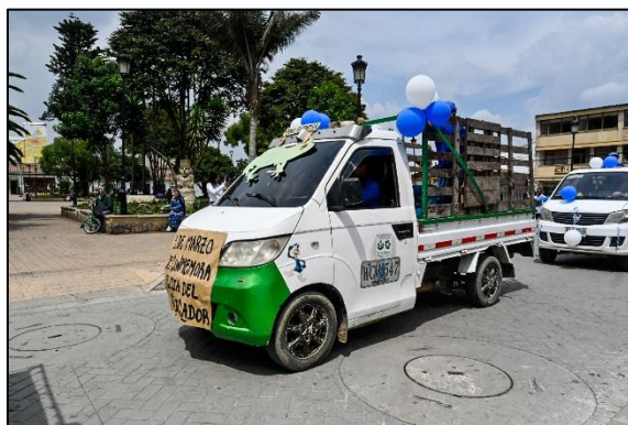
Imagen 1. Asociados ARBUIC y representación de anfibios y reptiles