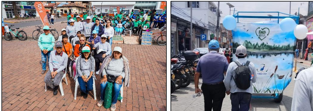
Imagen 3. Asociados TINGUA y representación del Humedal Gualí