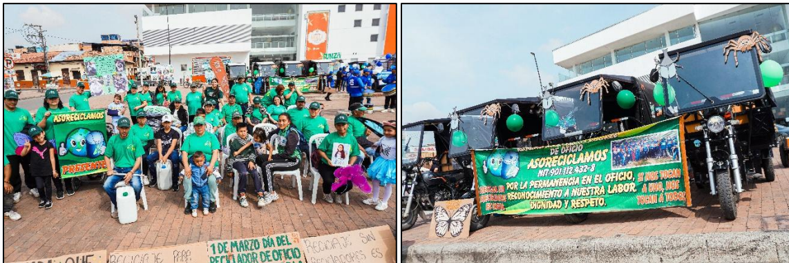
Imagen 6. Asociados ASORECICLAMOS y representación de los insectos del Humedal Gualí

Terminada la presentación de cada una de las asociaciones de recicladores, se realiza entrega de refrigerio a los recicladores y a los demás participantes del evento.