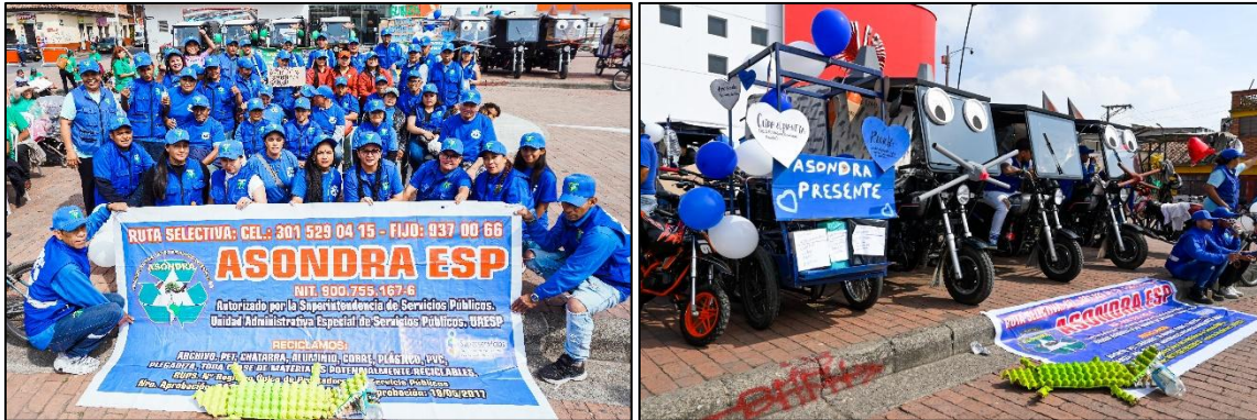
Imagen 5. Asociados ASONDRA ESP y representación de mamíferos del Humedal Gualí