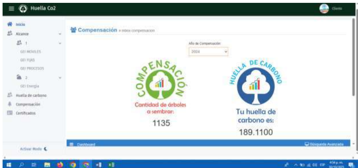
Ilustración 2. Calculo huella de carbono 2024.