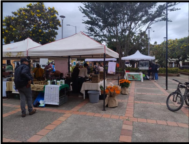
Imagen No. 4: Registro Fotográfico mercado campesino Tabio.