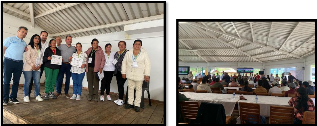
Imagen No. 3: Registro Fotográfico certificación ganadería sostenible.

Por otro lado, mediante el convenio con Fedegán sobre ganadería sostenible se realizaron las visitas a campo a 13 ganaderos, se ha realizado mesas de trabajo, se tiene programado la entrega de insumos el 7 de mayo, la mecanización y diagnóstico reproductivo en mayo.