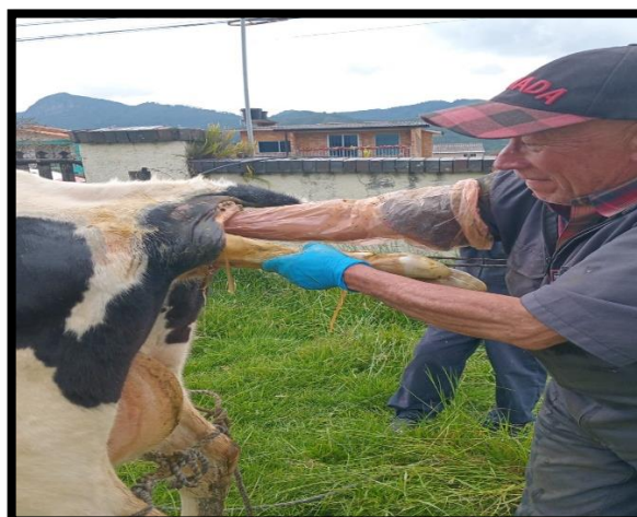
Imagen No. 1: Registro Fotográfico y planilla de asistencia