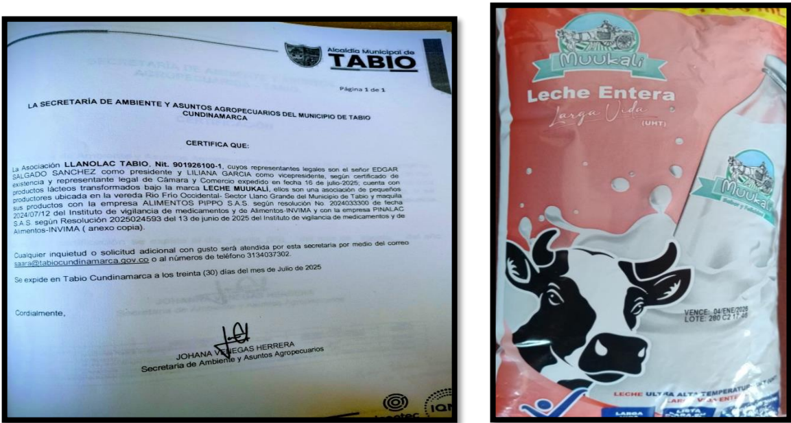
Imagen No. 4: Registro Fotográfico LLANOLAC (MUUKALI).

el 11 de marzo de 2025 se cuenta con el registro de llanolac ante cámara de comercio