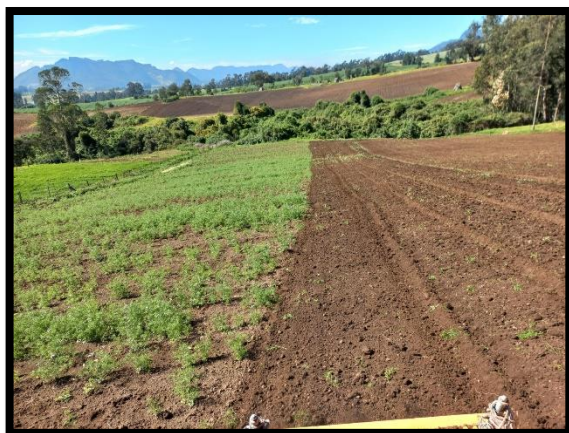
Imagen No. 2: Registro Fotográfico y planilla de asistencia