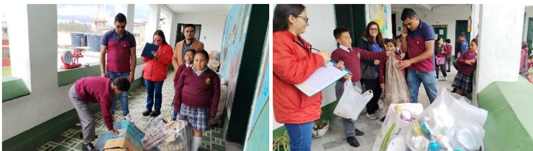
Socialización manejo de residuos generados en la plaza de mercado.

SECRETARÍA DE INFRAESTRUCTURA Y SERVICIOS PÚBLICOS