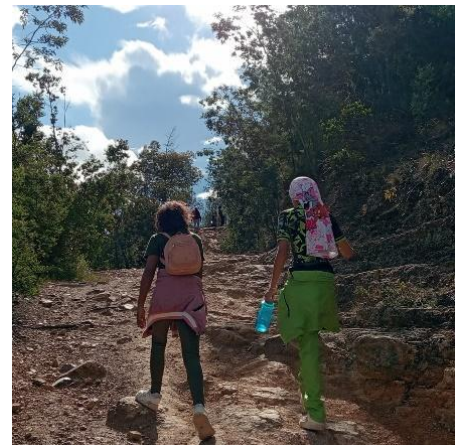
Salida pedagógica con grados quintos de Colegio General Santander para generar conciencia sobre cuidado de ecosistemas, uso adecuado de recurso hídrico y gestión adecuada de residuos.