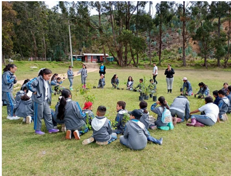
Caminata ambiental y Charla sobre el cuidado del agua a la escuela de patinaje en el mirador de la Zeta.