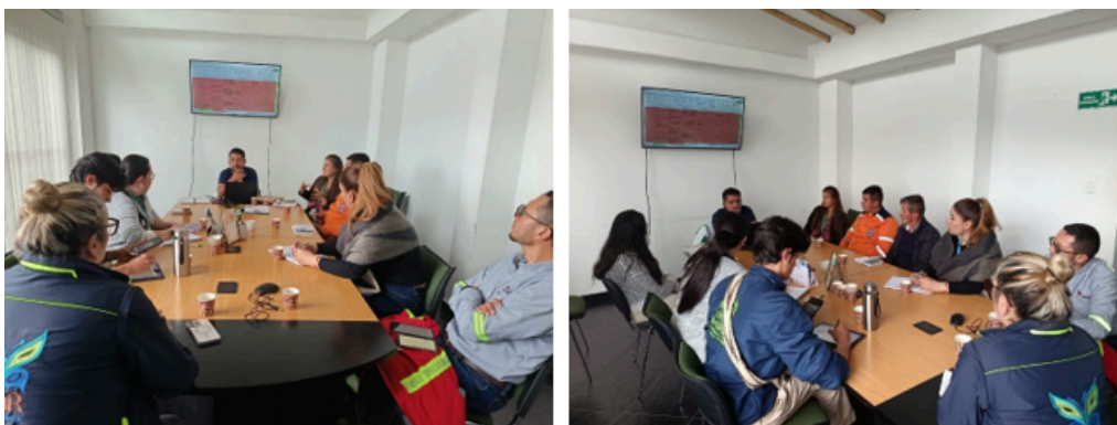
Imagen 12: Reuniones CIDEA 2025.

Durante el año 2025 la Unidad de Desarrollo Agropecuario en función de secretaría técnica, realiza las 4 reuniones del Comité Interinstitucional de Educación Ambiental, de acuerdo a lo estipulado en el Decreto 027 de 2021, en donde se lleva a cabo de las acciones realizadas o proyectadas en el plan de acción del CIDEA. Se adjunta actas de reunión.