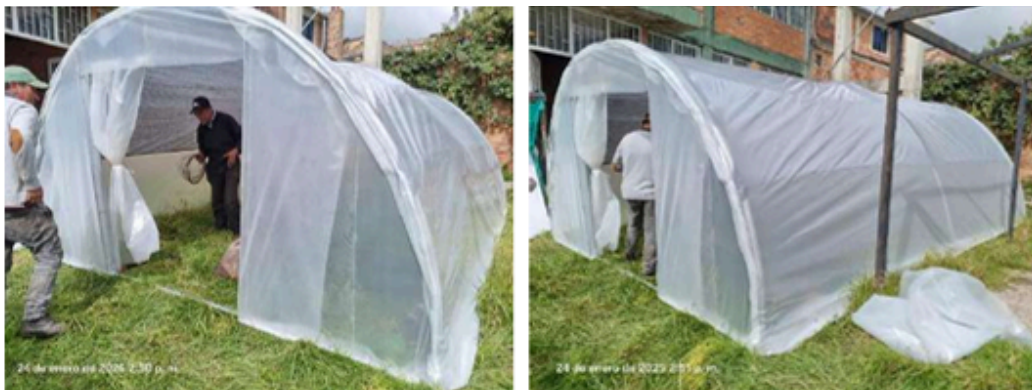
Imágenes 1-2: Fortalecimientos de Vivero a institución 2025.