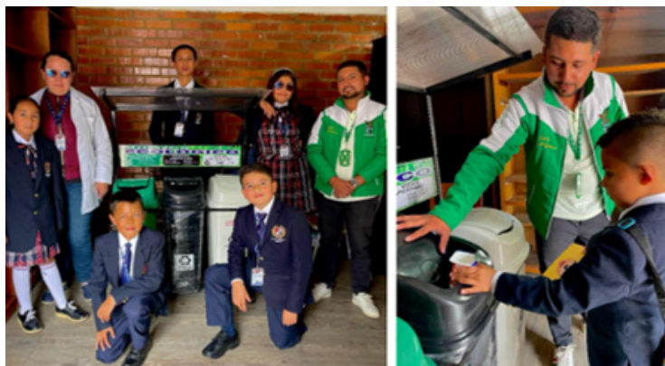
Imágenes 3-4: Fortalecimientos de puntos ecológicos a instituciones 2025.

Para el mes de marzo se lleva a cabo la entrega de un punto ecológico a las instituciones educativas Mario Benedetti, Liceo Moderno y Cacicazgo con el fin de apoyar los proyectos ambientales escolares de la institución, esto acompañado de una capacitación con respecto al uso y manejo adecuado de los residuos sólidos, así mismo se logra incentivar al fortalecimiento de las diferentes técnicas de reciclaje con respecto al cuidado del medio ambiente.