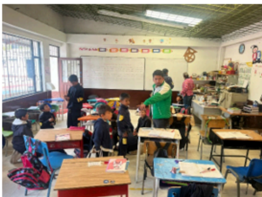
I.E.D Pablo VI sede Tenería.