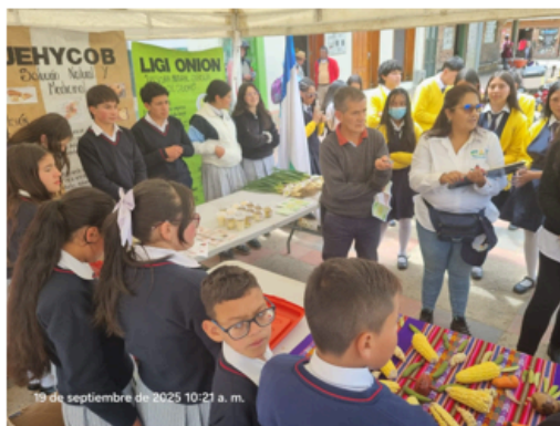
Imágenes 9-10: 1er Concurso de Experiencias Significativas 2025.