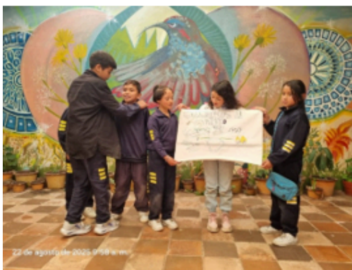
I.E.D Pablo VI sede San Vicente.