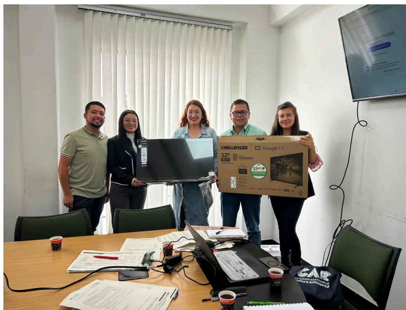
Imagen 11: Premiación Concurso de Experiencias Significativas 2025.

De acuerdo a la rúbrica plasmada, se premiarán a las 3 instituciones con mayor puntaje, en este caso la Institución Educativa Departamental Pablo VI, Institución Educativa Departamental San Juan Bosco y la Institución Psicopedagógica Mario Benedetti fueron los ganadores de esta primera versión del concurso de experiencias significativas.