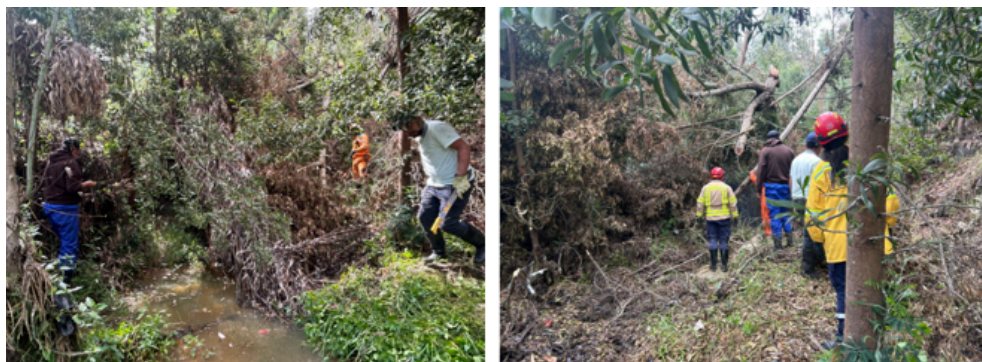
Imágenes 6-7: 2da Jornada de limpieza quebrada La Gacha Cacicazgo.

constante de agua y generando represamiento de residuos contaminantes provenientes de la mala disposición por parte de los residentes del sector.