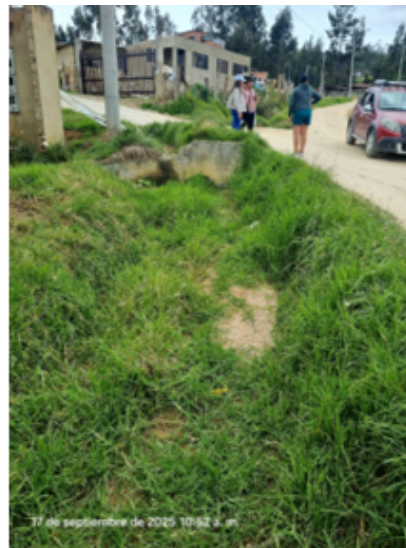
Imágenes 1-3: Diagnóstico Limpieza de Quebradas.