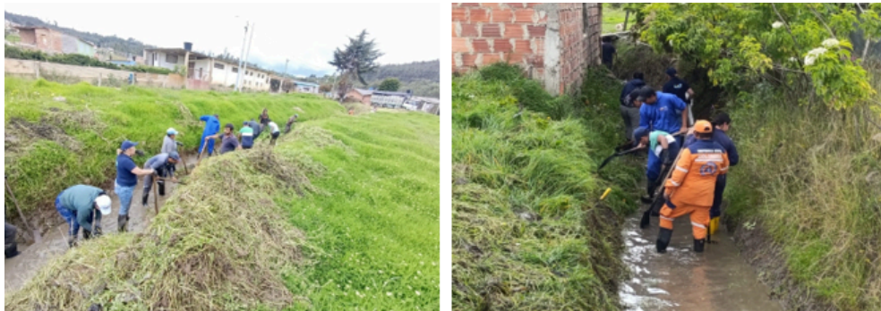
Imágenes 4-5: 1ra Jornada de limpieza quebrada La Gacha Cacicazgo.

El día 24/07/2025 se realiza la jornada de limpieza DE LA QUEBRADA GACHA de la vereda CACICAZGO. encabeza de la Unidad de Desarrollo Agropecuario, articulada con defensa civil, JAC Cacicazgo, CAR y demás población aledaña.