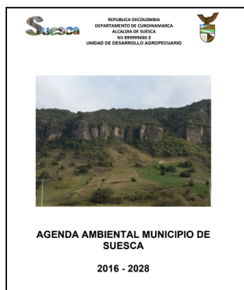
Imágenes 1–2: Recopilación de información secundaria del municipio de suesca.