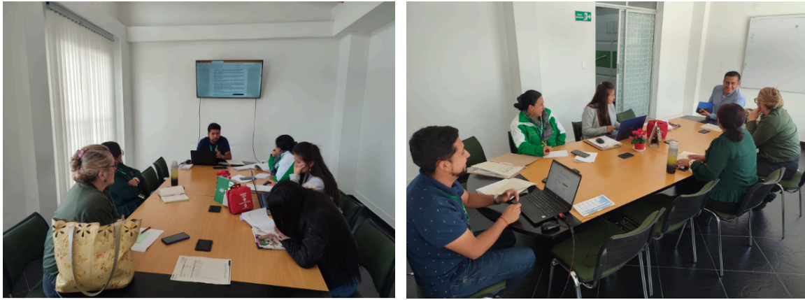
Imágen 7-8: Reunión Reactivación de consejo ambiental municipal..