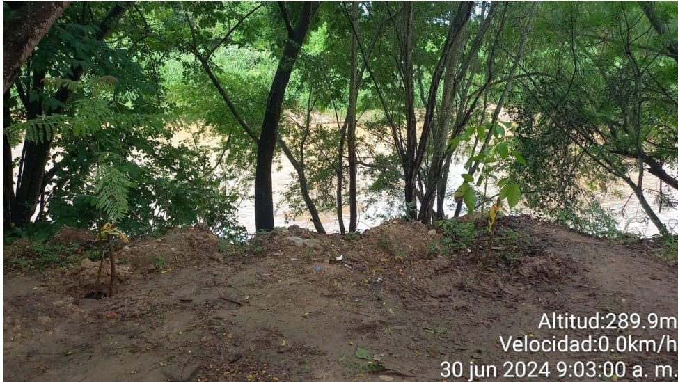
Ronda hídrica del Río Sumapaz.