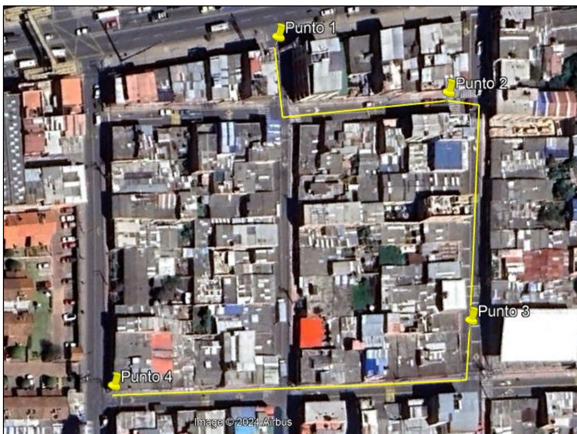
Ilustración 1. Recorrido verificación ambiental

Con base en lo anterior, el día 26 de noviembre de 2024 se realizó recorrido de control y vigilancia en el barrio Bellisca desde las coordenadas 4°42'58,122"N- 74°12'16,218"W hasta las coordenadas 4°42'53,472"N- 74°12'16,674"W (ver ilustración 1. Ruta amarilla).