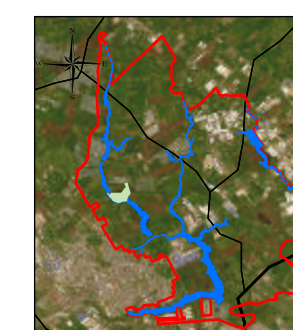
LOCALIZACION A NIVEL MUNICIPAL