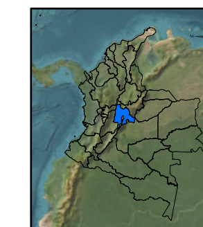
LOCALIZACION A NIVEL NACIONAL