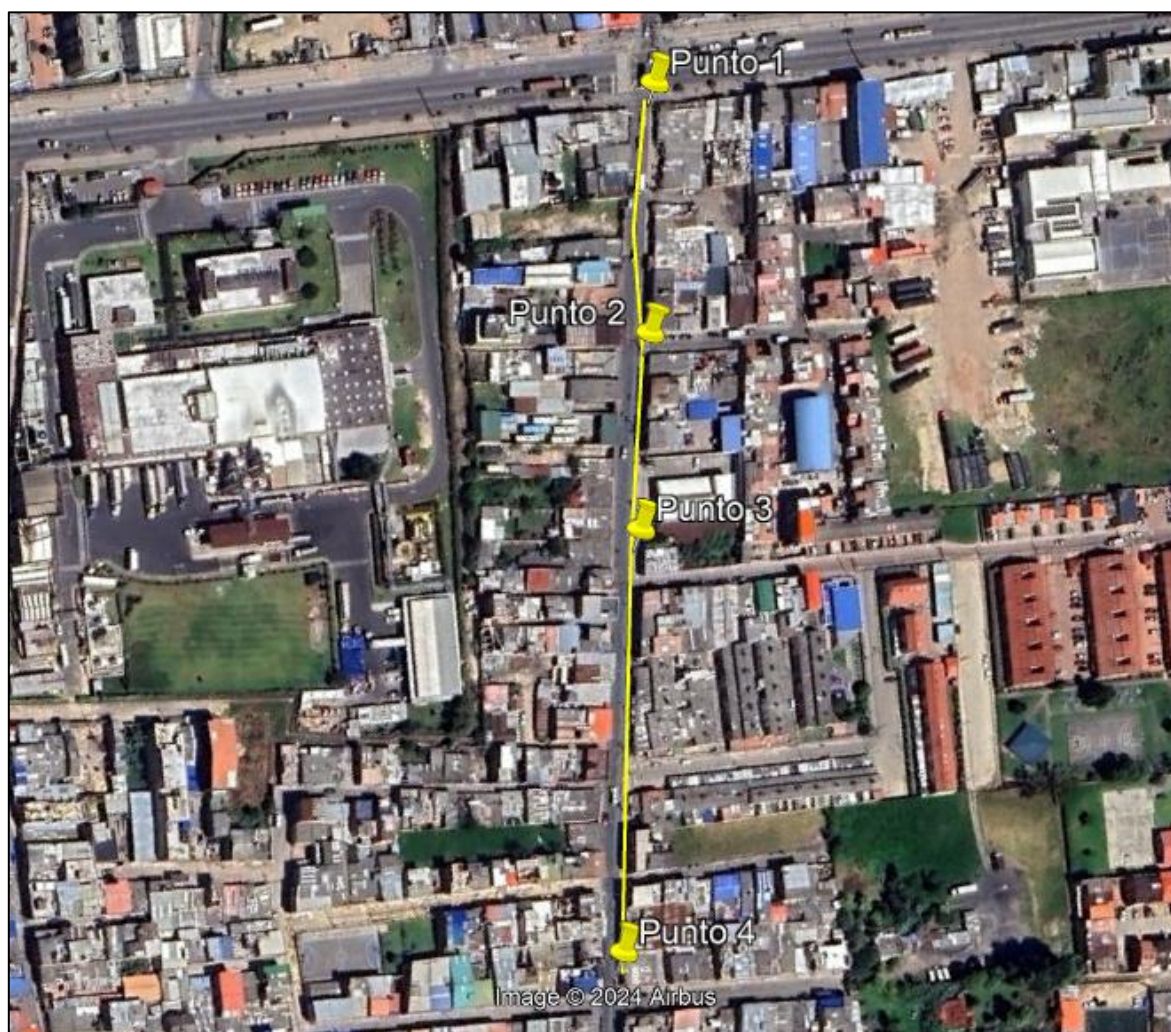
Ilustración 1. Recorrido verificación ambiental

Con base en lo anterior, el día 07 de octubre de 2024 se realizó recorrido de control y vigilancia en el barrio Serrezuelita desde las coordenadas 4°42'43,721"N- 74°12'39,272"W hasta las coordenadas 4°42'33,706"N- 74°12'35,077"W (ver ilustración 1. Ruta amarilla).