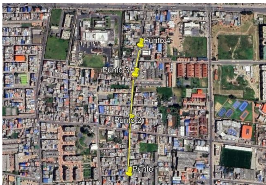
Ilustración 1. Recorrido

Con base en lo anterior, el día 30 de julio se realizó recorrido de control y vigilancia en el cuadrante 2, barrio Serrezuelita desde las coordenadas 4°42'26.062"N-74°12'31.070"W hasta las coordenadas 4°42'39.208"N- 74°12'37.638"W (ver ilustración 1. Ruta amarilla).