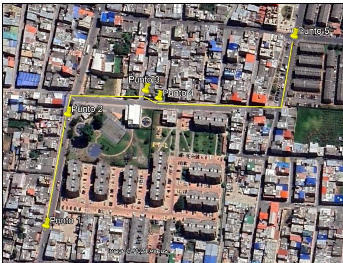
Ilustración 1. Recorrido verificación ambiental

Con base en lo anterior, el día 11 de septiembre de 2024 se realizó recorrido de control y vigilancia en el barrio Serrezuelita desde las coordenadas 4°42'27,044"N- 74°12'41,838"W hasta las coordenadas 4°42'24,152"N- 74°12'30,093"W (ver ilustración 1. Ruta amarilla).