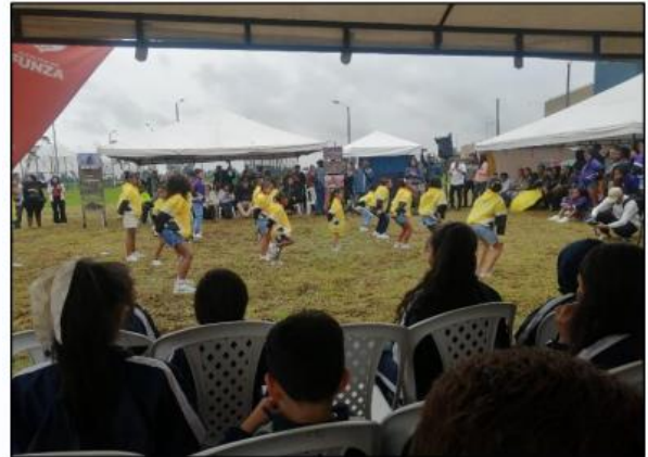
Fuente: Grupo guardianes por el ambiente – celebración día del río Bogotá