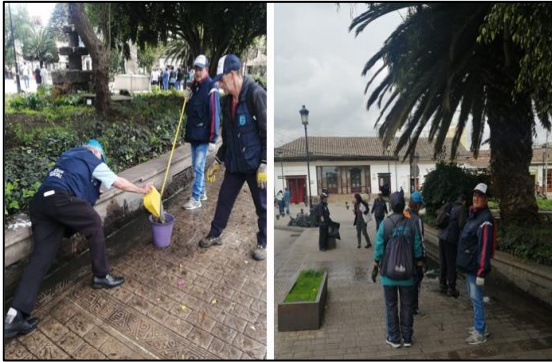
Fuente: Grupo guardianes por el ambiente – limpieza parque principal

Los guardianes por el ambiente como contraprestación por las labores descritas anteriormente recibieron bonos canjeables por un valor de $350.000 en lo correspondiente a las actividades ejecutadas en el periodo del 24 de abril al 24 de junio, entregándose un total de veintiséis (26) bonos, como se muestra en la siguiente tabla: