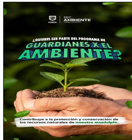
Imagen 1. Participación en el programa guardianes por el ambiente.

6. Soportes que acrediten la condición de vulnerabilidad o veedor ambiental.