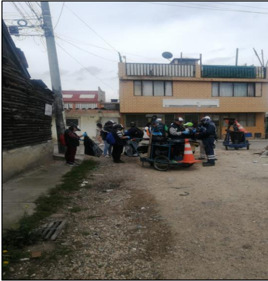
Fuente: Grupo guardianes por el ambiente – limpieza puntos críticos en el área urbana