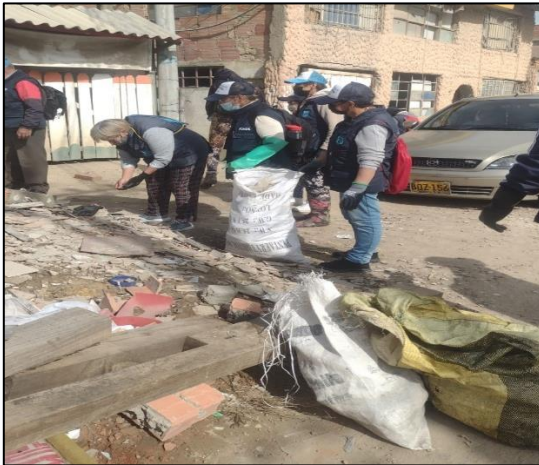
limpieza puntos críticos en el área rural