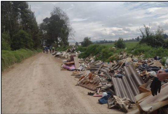
Fuente: Grupo guardianes por el ambiente – limpieza puntos críticos en el área rural