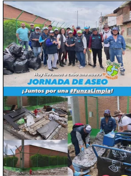
Fuente: Grupo guardianes por el ambiente – limpieza puntos críticos en el área urbana

El programa guardianes por el ambiente realiza apoyo a limpieza de puntos críticos en el área urbana, así como de vallados en el área rural y parques de la administración en colaboración con el grupo de residuos sólidos y podas de la Secretaria de Ambiente y Bienestar Animal y la Empresa Municipal de Agua y Alcantarillado de Funza EMAAF, el programa también apoyo de manera regular la limpieza de jardines y áreas comunes del parque principal municipal, con esta acción no solo se mantiene limpia la sala principal del municipio sino que además se promueven las prácticas de apropiación del territorio.