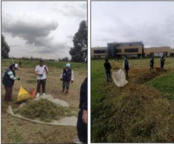
Fuente: Grupo guardianes por el ambiente – limpieza parque calabazal

humedal Gualí tramo tres esquinas en la cual se llevo a cabo la celebración del día del humedal Gualí en el mes de junio.