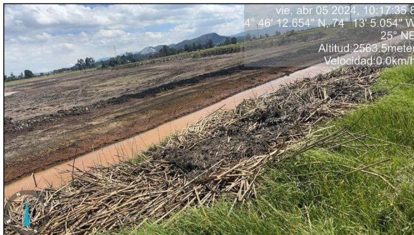
Ilustración 7. Material vegetal endémico retirado

Por otro lado, en el recorrido se evidenció maquinaria tipo retroexcavadora (oruga) la cual se estaba utilizando para el retiro de material vegetal de la zona de preservación (espejo de agua) y la zona de recuperación, observándose el retiro de vegetación endémica del humedal tales como: Junco, el cual se encontraba en el área.