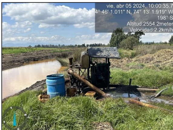
Ilustración 5. Motobomba #1 captando agua del humedal