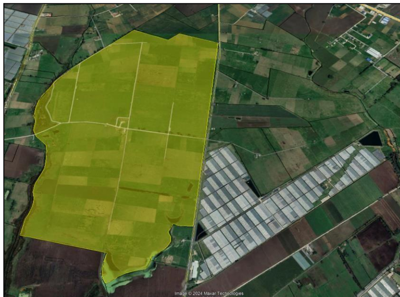
Ilustración 1. Ubicación predio

El día 05 de abril del 2024, se realizó recorrido de control y vigilancia en la ronda del humedal Gualí, ecosistema que fue declarado por la Corporación Autónoma Regional de Cundinamarca - CAR como Distrito Regional de Manejo Integrado a través del acuerdo 001 de 2014 "Por medio del cual se declaran como Distrito Regional de Manejo Integrado (DMI), los terrenos comprendidos por los humedales de Gualí, Tres Esquinas y Lagunas de Funzhé, y su área de influencia directa ubicada en los municipios de Funza, Mosquera y Tenjo, Cundinamarca", y estableció tres zonas: 1. Preservación (espejo de agua), 2. Recuperación (50 metros) y 3. Uso sostenible (100 metros), con el fin de identificar presuntas afectaciones ambientales. Dentro del recorrido se identificaron dos motobombas y maquinaria presente en el predio denominado "Furatena" (polígono amarillo), ubicado en la vereda el Cacique, coordenadas 4°46'13.840" N y 74°13'2.875" W, como se muestra en la siguiente ilustración: