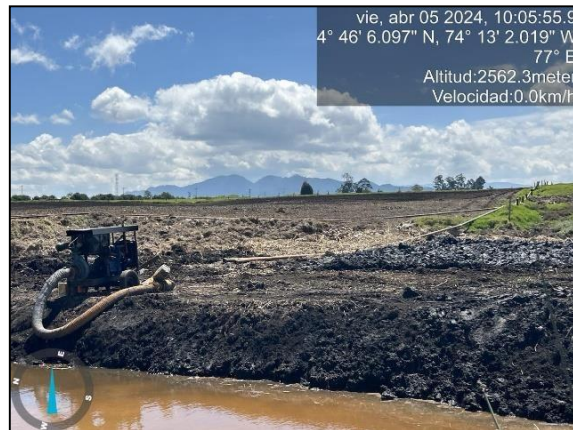
Ilustración 6. Motobomba #2 en la ronda

Por otro lado, en el recorrido se evidenció maquinaria tipo retroexcavadora (oruga) la cual se estaba utilizando para el retiro de material vegetal de la zona de preservación (espejo de agua) y la zona de recuperación, observándose el retiro de vegetación endémica del humedal tales como: Junco, el cual se encontraba en el área.