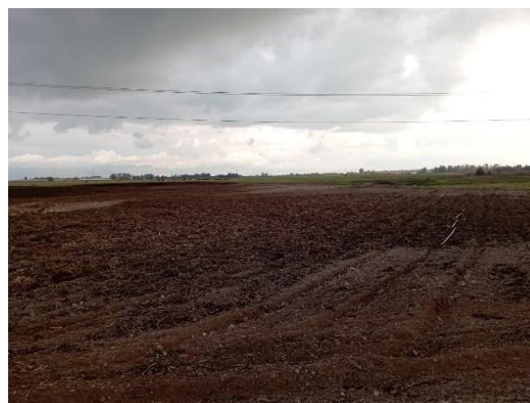
Ilustración 4. Actividad agrícola

Durante el recorrido de control y vigilancia por la Ronda del Humedal Gualí se evidenciaron dos motobombas, una estaba en funcionamiento y la otra se encontró apagada. La que estaba funcionando en el momento del recorrido se encontraba captando agua del humedal mediante una manguera para el riego de cultivos. (Ésta no se logró identificar a que predio pertenecía), sin embargo, la que se encontró apagada se identificó en el predio "Furatena".