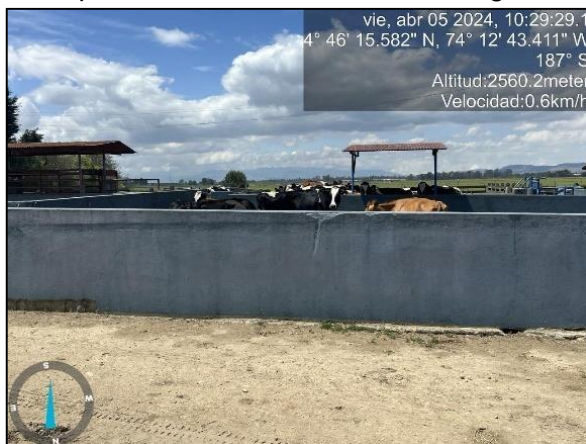
Ilustración 3. Actividad pecuaria

En el predio se realizan actividades agrícolas y pecuarias