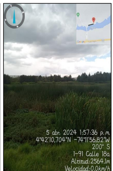
Ilustración 2. Evidencias recorrido