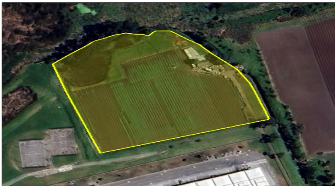
Ilustración 5. Predio El Reposo.

Esta motobomba se encuentra ubicada en el predio denominado “El Reposo” ubicado dentro del casco urbano del municipio de Funza, en inmediaciones al barrio Francisco Martínez Rico (Ver ilustración 5, polígono amarillo), en el cual se llevan a cabo actividades agrícolas (ver ilustración 6).