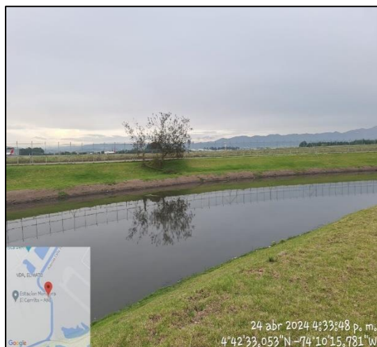
Foto 2. Punto recorrido río Bogotá