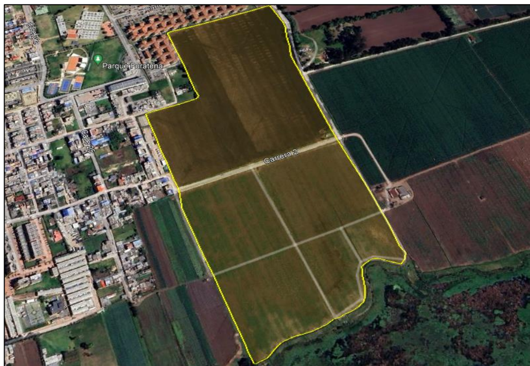
Ilustración 4. Predio las fanegadas Nuevo Recreo.

El predio denominado “LAS FANEGADAS NUEVO RECREO” se encuentra identificado con cedula catastral 25286000000000070071000000000, de conformidad con la consulta realizada en el geoportal del Instituto Geográfico Agustín Codazzi IGAC (ver ilustración 5).