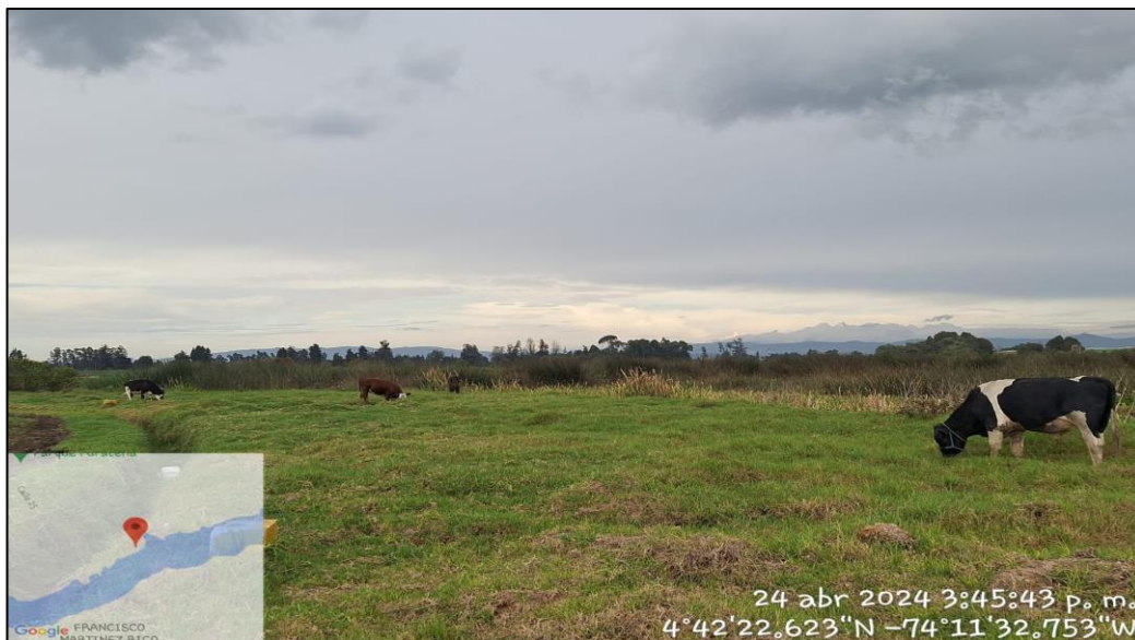
Ilustración 2. Semovientes ronda del Humedal Gualí.

C.P. 250020 Tel. +57(1) 823 40 70 823 40 71 / 823 40 73 Fax. + 57(1) 825 76 20 Dir. Cra. 14 No. 13-05