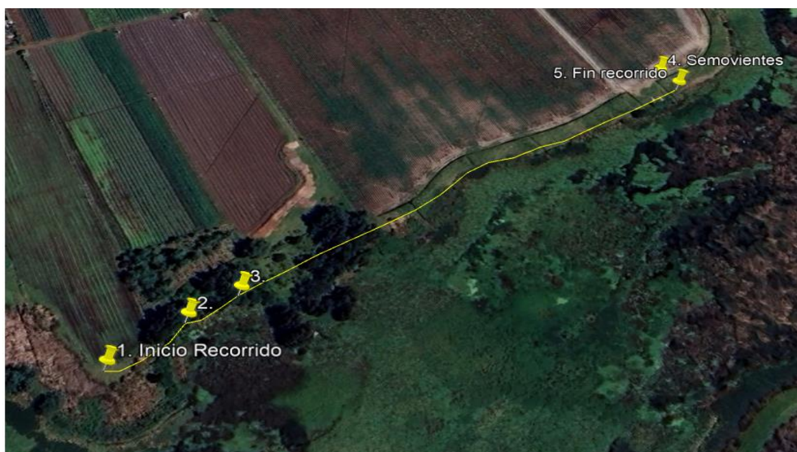
Ilustración 1. Recorrido de verificación ambiental - Ronda humedal Gualí

El día 24 de abril de 2024, se realizó recorrido de control y vigilancia en la ronda del humedal Gualí desde las coordenadas 4°42'16.279"N - 74°11'40.92"W hasta las coordenadas 4°42'22.298"N - 74°11'32.486"W (ver ilustración 1. Ruta amarilla) ecosistema que fue declarado por la Corporación Autónoma Regional de Cundinamarca - CAR como Distrito Regional de Manejo Integrado a través del acuerdo 001 de 2014 "Por medio del cual se declaran como Distrito Regional de Manejo Integrado (DMI), los terrenos comprendidos por los humedales de Gualí, Tres Esquinas y Lagunas de Funzhé, y su área de influencia directa ubicada en los municipios de Funza, Mosquera y Tenjo, Cundinamarca", y estableció tres zonas: 1. Preservación (espejo de agua), 2. Recuperación (50 metros) y 3. Uso sostenible (100 metros), con el fin de verificar las condiciones ambientales, identificar posibles afectaciones a los recursos naturales y realizar las acciones de prevención correspondientes.