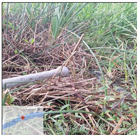
Ilustración 3. Tubería de conducción y descarga de aguas en el Humedal Gualí.