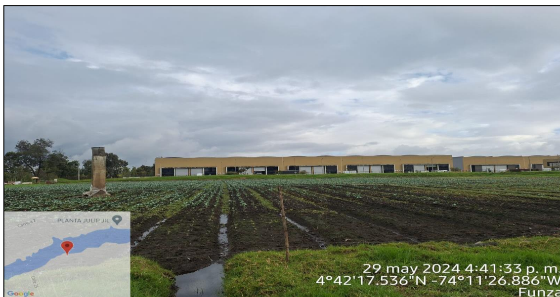
Ilustración 6. Actividad agrícola

El predio denominado “El Reposo” se encuentra identificado con cedula catastral 2528600000000000071268000000000, de conformidad con la consulta realizada en el geoportail del Instituto Geográfico Agustín Codazzi IGAC (ver ilustración 7).