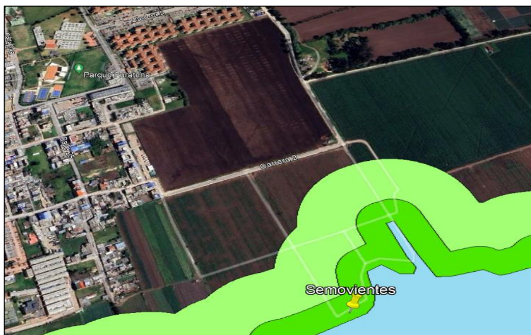
Ilustración 3. Zona de recuperación ronda del Humedal Gualí.