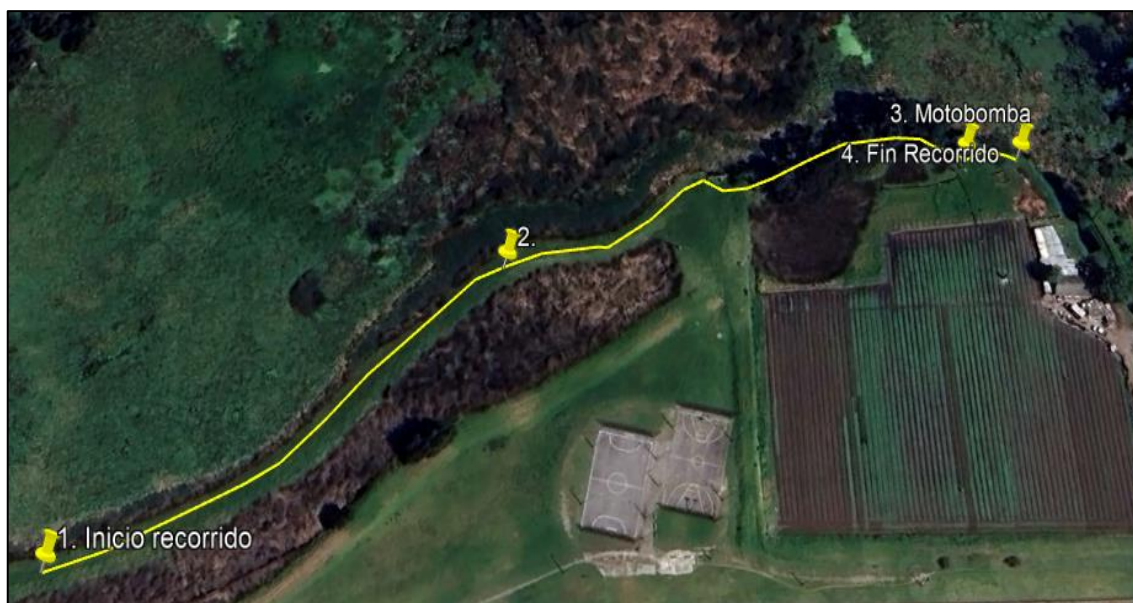
Ilustración 1. Recorrido verificación ambiental -Vereda 7 Trojes

El día 29 de mayo de 2024, se realizó recorrido de control y vigilancia en la ronda del humedal Gualí desde las coordenadas 4°42'11.771"N - 74°11'35.861"W hasta las coordenadas 4°42'18.218"N - 74°11'26.47" W (ver ilustración 1. Ruta amarilla) ecosistema que fue declarado por la Corporación Autónoma Regional de Cundinamarca - CAR como Distrito Regional de Manejo Integrado a través del acuerdo 001 de 2014 "Por medio del cual se declaran como Distrito Regional de Manejo Integrado (DMI), los terrenos comprendidos por los humedales de Gualí, Tres Esquinas y Lagunas de Funzhé, y su área de influencia directa ubicada en los municipios de Funza, Mosquera y Tenjo, Cundinamarca", y estableció tres zonas: 1. Preservación (espejo de agua), 2. Recuperación (50 metros) y 3. Uso sostenible (100 metros), con el fin de verificar las condiciones ambientales, identificar posibles afectaciones a los recursos naturales y realizar las acciones de prevención correspondientes.