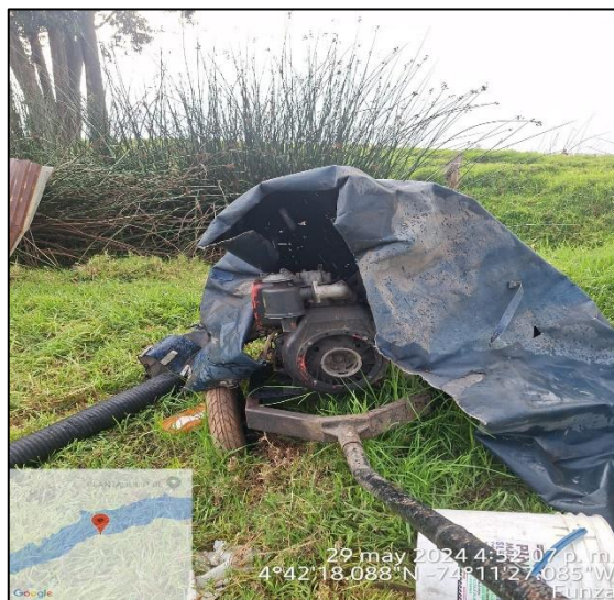
Ilustración 2. Motobomba.

C.P. 250020 Tel. +57(1) 823 40 70 823 40 71 / 823 40 73 Fax. + 57(1) 825 76 20 Dir. Cra. 14 No. 13-05