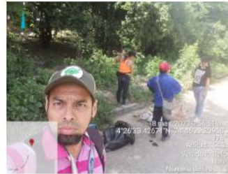
Jornada de Implementación Proceso de Limpieza de Punto Crítico Vereda La Reforma CIDEA de Nariño 8 de Mayo de 2023