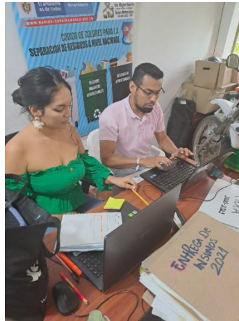
Foto de la Mesa de trabajo con la Secretaria Técnica del CIDEA de Nariño 21 de febrero de 2023 desarrollando la siguiente agenda Retroalimentación de la gestión ejecutada e inicio de procesos de planeación en educación ambiental para la vigencia 2023, Diagnóstico a través de Matriz DOFA del PTEA, Socialización y actualización de actores y equipo de trabajo del PTEA – CIDEA, Diligenciamiento Instrumento de Revisión y Análisis PTEA y porcentaje de avance, Planeación y cronograma de Reuniones del Comité CIDEA