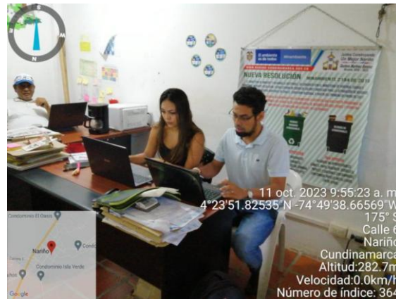
Mesa de Trabajo con la Profesional Ambiental de la Umata Alcaldía de Nariño para la Revisión y Ajuste al Instrumento del PTEA y Matriz de Armonización 11 de octubre de 2023