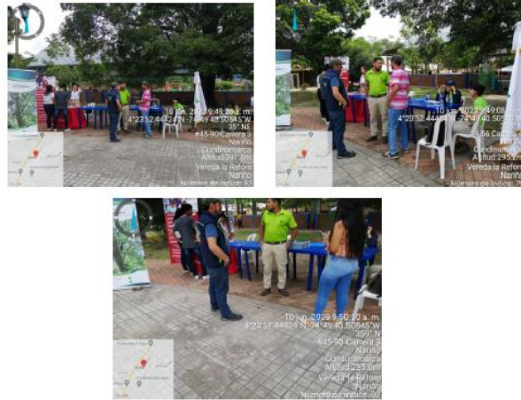
Desarrollo de la Primera Jornada Feria Institucional en el Municipio de Nariño 10 de junio de 2023