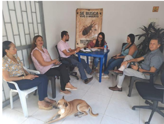
Foto Reactivación CIDEA Nariño Desarrollando la siguiente agenda Retroalimentación de la gestión ejecutada e inicio de procesos de planeación en educación ambiental para la vigencia 2023, Diagnostico a través de Matriz DOFA del PTEA, Socialización y actualización de actores y equipo de trabajo del PTEA – CIDEA, Diligenciamiento Instrumento de Revisión y Análisis PTEA y porcentaje de avance, Planeación y cronograma de Reuniones del Comité CIDEA 14 de marzo de 2023