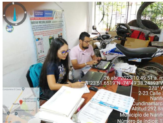
Mesa de Trabajo con la Secretaria Técnica del CIDEA de Nariño para el Ajuste y/o Actualización del Instrumento del PTEA, Programación de Acciones 2023, Acto Administrativo Actualizado del Comité CIDEA y Revisión de la Matriz de Armonización para su Respectivo Ajuste 26 de abril de 2023