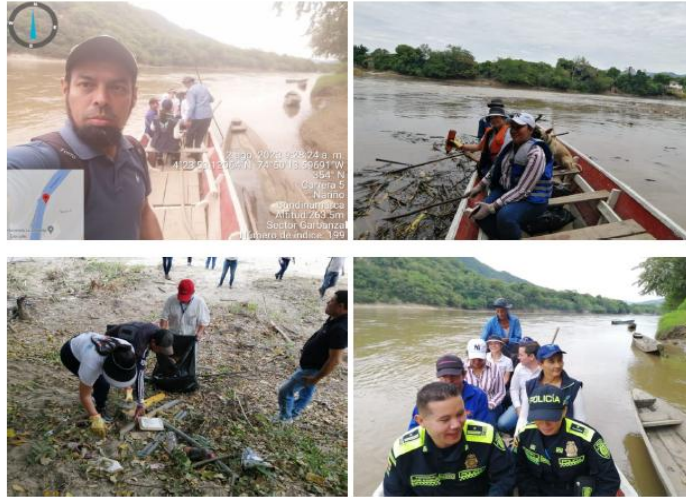
Jornada de Implementación CIDEA Nariño Limpieza Orilla Rio Magdalena 2 de agosto de 2023