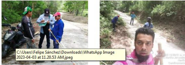
Jornada de Implementación Sector Juan Chiquillo Recuperación de Punto Critico a través de una actividad de Limpieza 3 de abril de 2023