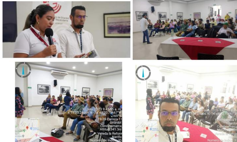
Jornada de Formación y Capacitación Regional sobre Turismo de Naturaleza 30 de mayo de 2023