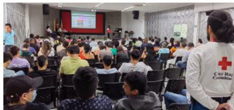
Desarrollo del Evento Regional sobre Gestión del Riesgo “Emergencia Volcánica” en Armonía con la Estrategia No 10 de la Política Nacional de Educación Ambiental 15 de mayo de 2023