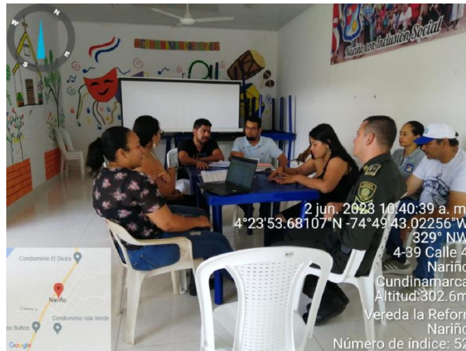
Segunda Sesión Ordinaria del CIDEA de Nariño Desarrollando la siguiente agenda, Acciones Desarrollada del CIDEA primer semestre 2023, Socialización de la Actualización del Acto Administrativo, Socialización Instrumento de Revisión y Análisis PTEA y porcentaje de Avance 2 de junio de 2023.