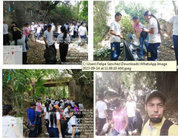
Foto Jornada de Implementación en el marco “DÍA MUNDIAL DE LIMPIEZA” CIDEA Nariño 14 de septiembre de 2023