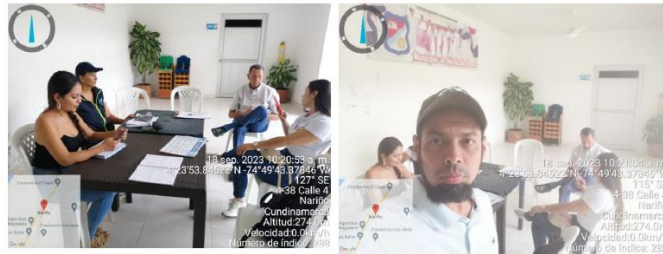
Foto Tercera Sesión CIDEA Municipio de Nariño 18 de septiembre de 2023