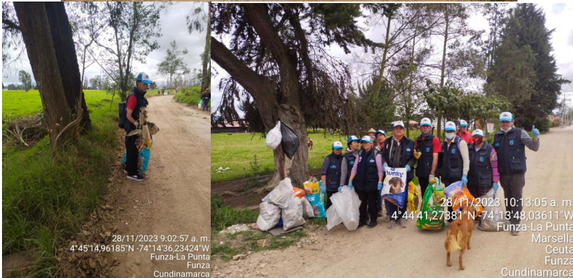
28/11/2023 9:02:57 a. m. 4°45'14,96185"N -74°14'36,23424"W Funza-La Punta Funza Cundinamarca