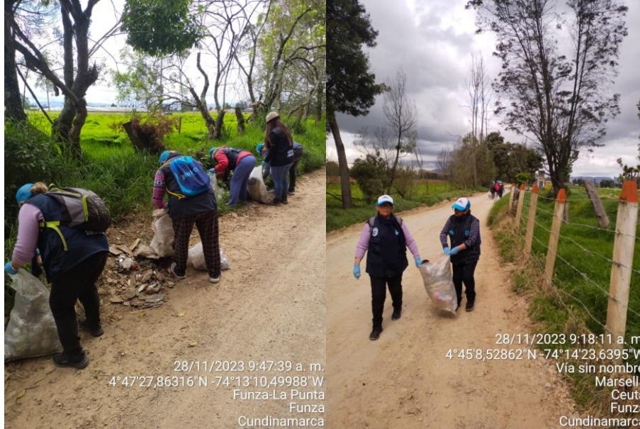
28/11/2023 9:47:39 a. m. 4°47'27,86316"N -74°13'10,49988"W Funza-La Punta Funza Cundinamarca