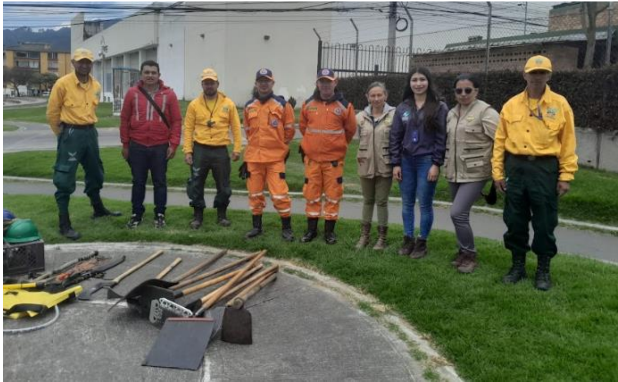
Curso de módulos participativos