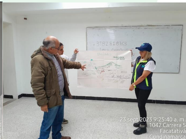
23 sept 2023 9:25:40 a. m. 1042 Carrera 5 Facatativá Cundinamarca