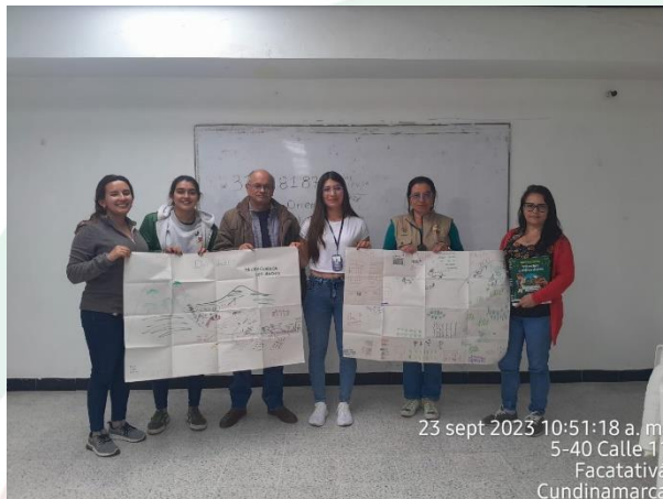
23 sept 2023 10:51:18 a. m. 5-40 Calle 11 Facatativá Cundinamarca