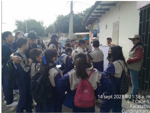
14 sept 2023 8:21:36 a. m. 5-7 Calle 11 Facativá Cundinamarca