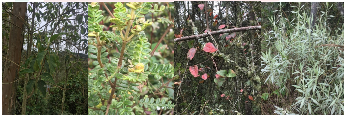
Imagen 8. Especies presentes en el predio

En el recorrido se puede observar un parche de bosque nativo de especies arbóreas como: tuno, sauco, artemisa, encenillo, helechos, siete cueros, arrayán, y alisos.