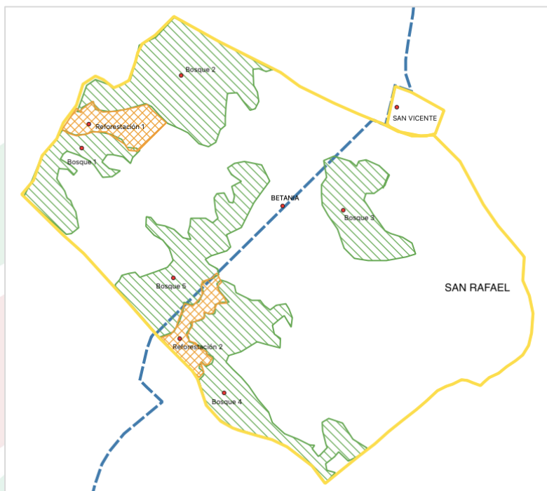
Imagen 13. Parches de bosque en conservación y reforestación