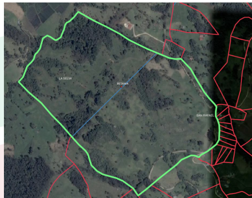
Imagen 2. Limite veredal (azul) – predio en medio de La Selva y San Rafael