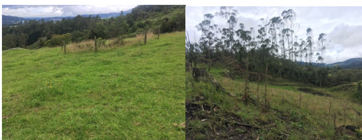
Imagen 7. Área de bosque para reforestar

De acuerdo con el levantamiento topográfico, se identifican 41 fg en bosque nativo, de las 77 fg totales del predio.