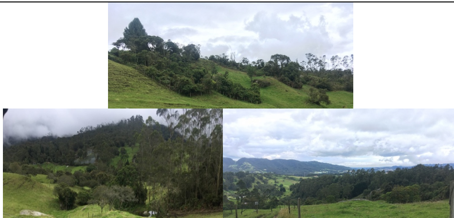
Imagen 6. Zonas de bosque conservado

De acuerdo con el levantamiento topográfico, se identifican 41 fg en bosque nativo, de las 77 fg totales del predio.