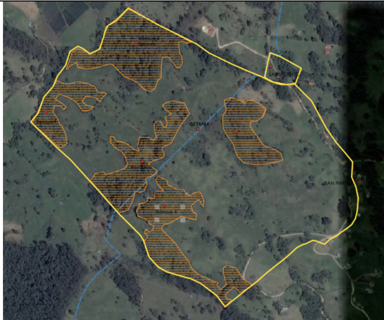
Imagen 12. Parches de bosque en conservación – capa satelital.