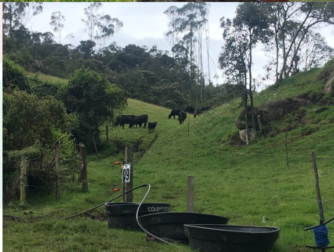
Imagen 9. Ganado