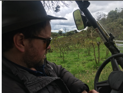
Imagen 10. Propietario