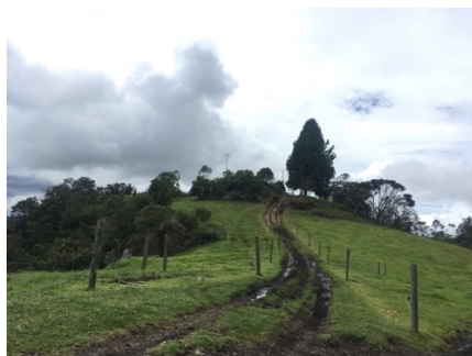
Imagen 5. Entrada a la vivienda