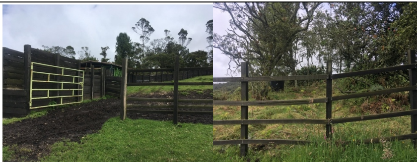
Imagen 4. Establo

La finca tiene doble cerca viva, en el costado este.