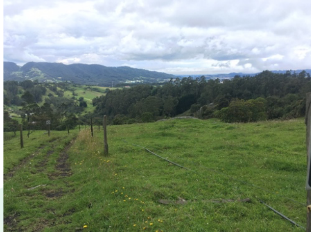
Imagen 7. Área propuesta para implementación de sistema silvopastoril. Lote 12 y Lote 17.

El área de las implementaciones de los sistemas silvopastoril, son iguales, debido a que la finca fue loteada en polígonos de la misma área. Aproximadamente 1 hectárea cada uno.