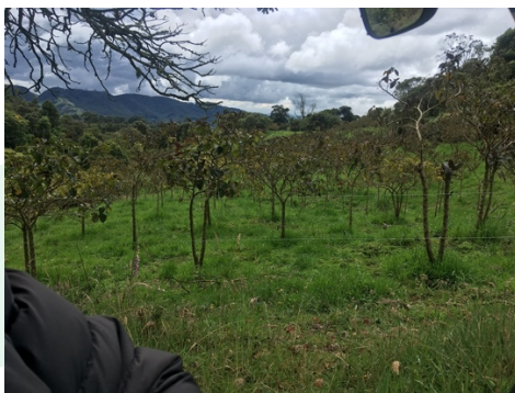
Imagen 3. Cultivo de tomate de árbol

Tenían un cultivo de tomate de árbol, sin embargo, fracasó, debido a que le dio una enfermedad. Causando seria intoxicación a las vacas, se empezó a realizar rotación de cultivos, sin químicos e implementación de un sistema silvopastoril.