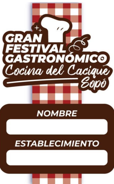
Escarapela de participantes