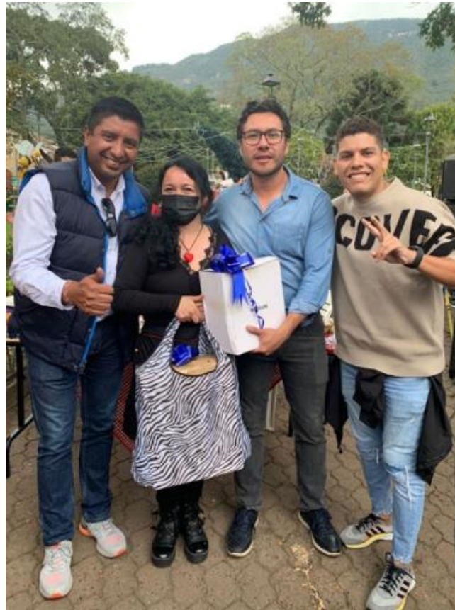
Primer puesto 3 Bohíos