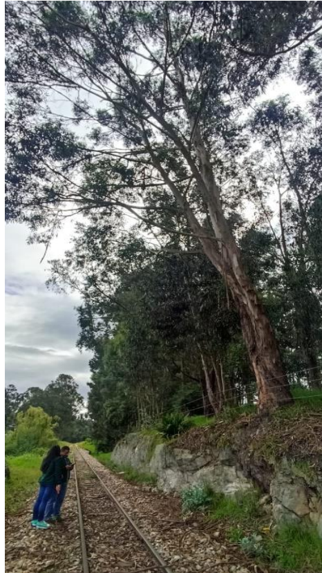
Registro fotográfico Visitas técnicas ambientales 2022