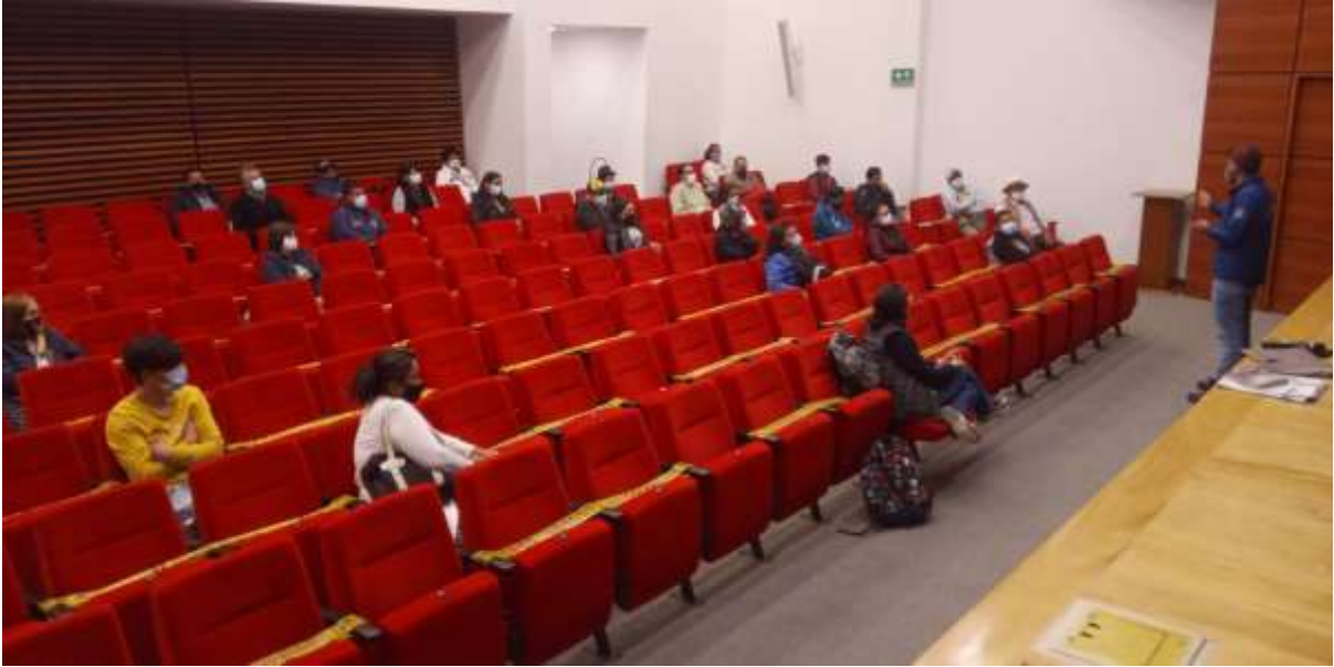
Registro fotográfico – Capacitación LLUVIA PARA LA VIDA – CAR y Secretaría de Ambiente 21/08/2021