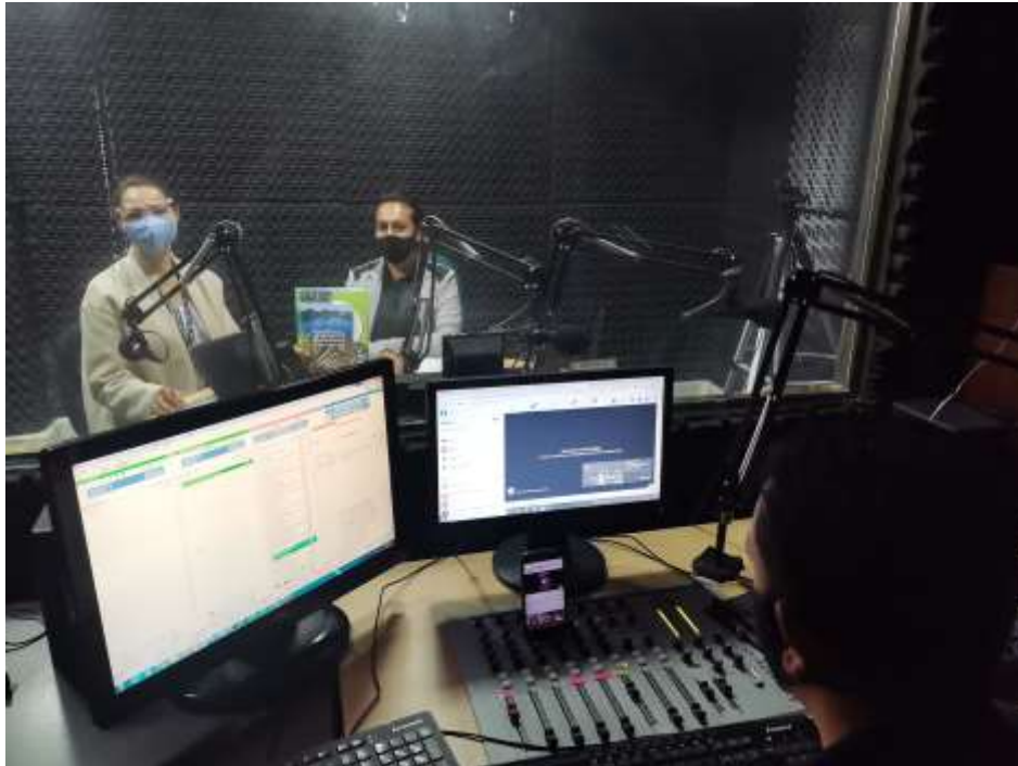
Registro fotográfico – Emisora Sopó Radio 24/08/2021