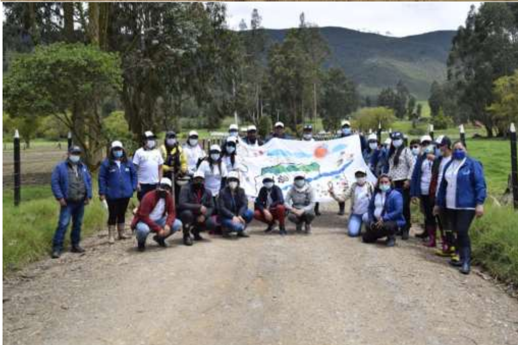
Registro fotográfico – Telas Vive El Río Bogotá 04/05/2021 Vereda La Violeta – Río Teusacá – Sopó