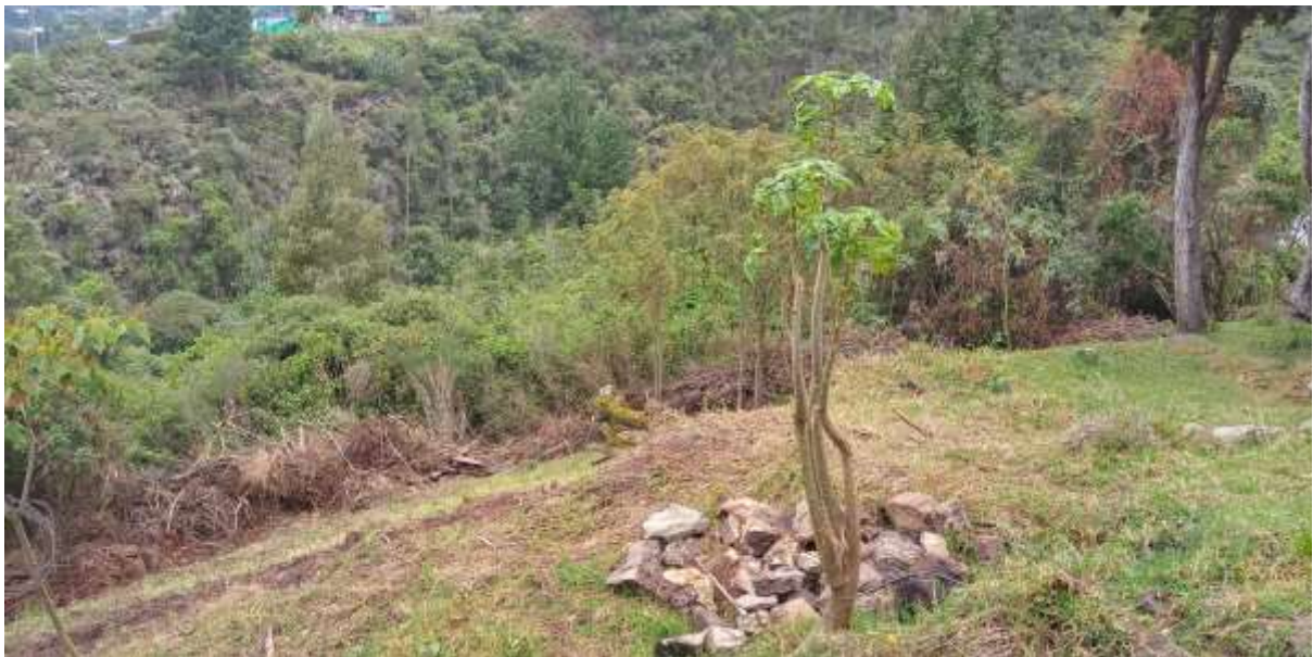
Registro fotográfico Visitas técnicas ambientales 2021